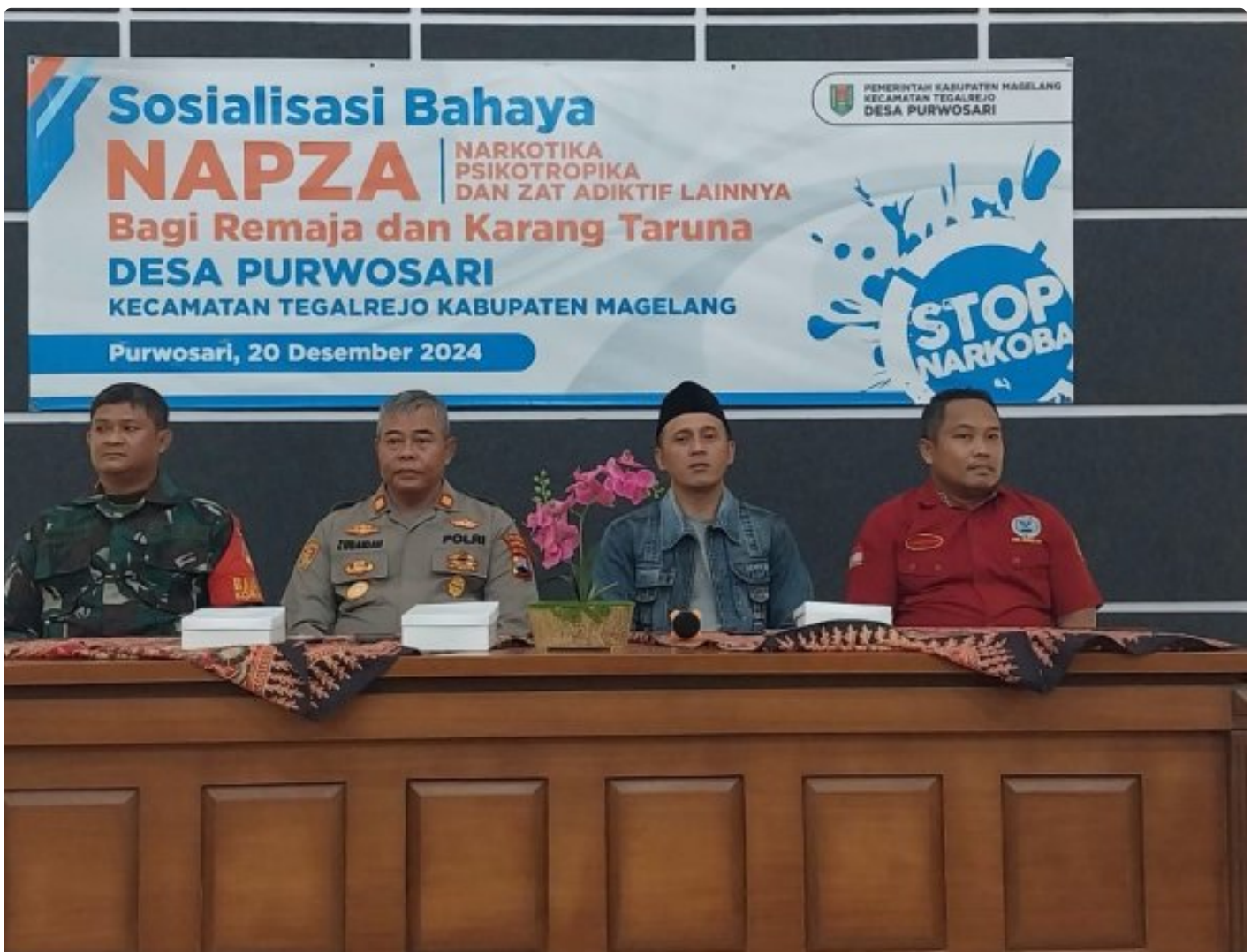
(Foto Dokumen) : Kegiatan sosialisasi bahaya narkoba dan kenakalan remaja

MAGELANG - Anggota Koramil 09/Tegalrejo bersama Polsek setempat dan anggota BNN memberikan sosialisasi tentang bahaya narkoba dan kenakalan remaja kepada anak-anak remaja Karang Taruna Desa Purwosari, Kecamatan